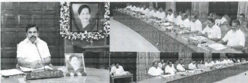
தரணவாசல் எடப்பாடி பழனிமீதி தலைமையில் தலைமை செயலகத்தில் தலைநகர்வைக் கூட்டம் தடைபடுத்தி